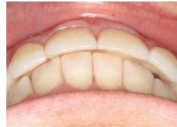
Nach der Behandlung