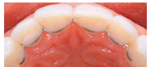
Ziel (mit dem 3D-Titan-Retainer)